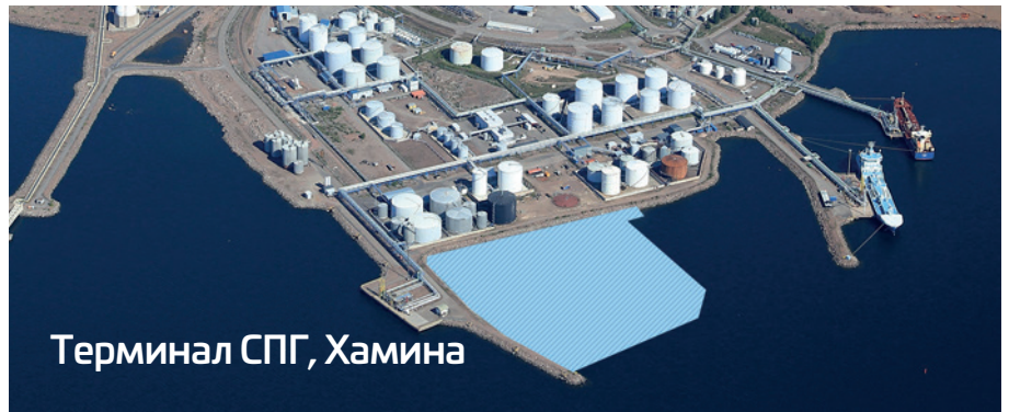
Терминал по приему сжиженного природного газа в портовом районе Хамина будет строиться в течение трех лет и обойдется примерно в 95 миллионов евро.