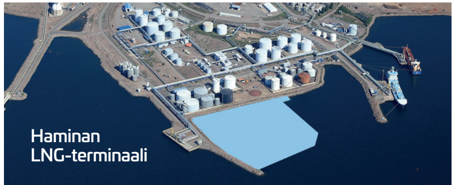
LNG-vastaanottoterminaalin rakentaminen Haminan satamassa kestää kolme vuotta ja sen arvo on noin 95 miljoonaa euroa.