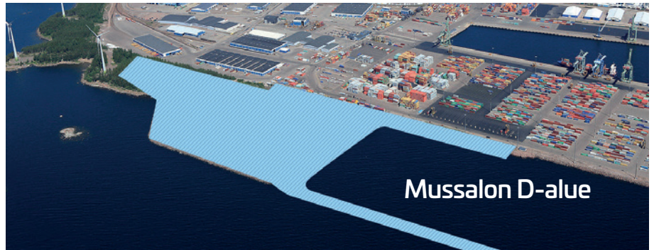
Mussaloon rakennettava uusi satamakeskus palvelee erityisesti metsäteollisuuden kuljetuksia.